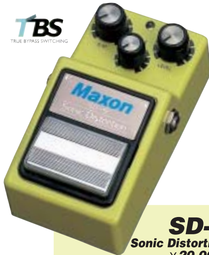
SD-9 Sonic Distortion ¥20,000

ブライトなトーンをもった抜けた良いディストーション効果を再現。低音から高音まですべてに鋭敏なピッキング・レスポンスを發揮します。美しく響く倍音は高域の輝きをプロデュースします。トーンコントロールにより、エッジの効いたキレの良いディストーション・サウンドから芯のあるマイルドなオーバードライブ・サウンドまで幅広く設定可能。TBS(True Bypass Switching) 採用。