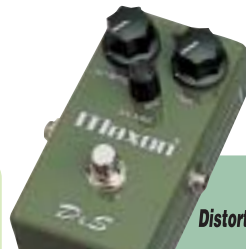
D&S Distortion & Sustainer ¥13,800

1974年に発売されたMAXONディストーションユニット第1号機。同シリーズのD&S2よりも更に強力な歪みで、圧倒的なロングサステインと激しく歪ませても音やせのないファズテイストな太い歪みは、まさに70年代王道サウンドです。