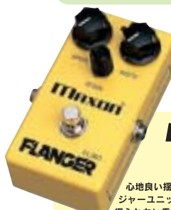
FL301 Flanger ¥16,000

心地良い揺れを表現するフランジャーユニット。アナログでしか得られない濃厚で深みのあるフランジング効果から繊細で温かなコーラス、ピブラットの効果までバラエティに富んだ音作りが可能です。ドライブ・サウンドとミックスすることで強烈なジェット・サウンドも得られます。