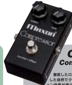
CP101 Compressor ¥14,500

徹底したローノイズ設計を追究した自然でクリアなコンプレッション効果が得られます。リズムカッティング時の音のツブ立ちを揃えるリミッターの効果やリード時の抜群なアタック感とサステインなど原音を活かした音作りが可能です。ポティーカーは輸出仕様と同じブラックになりました。