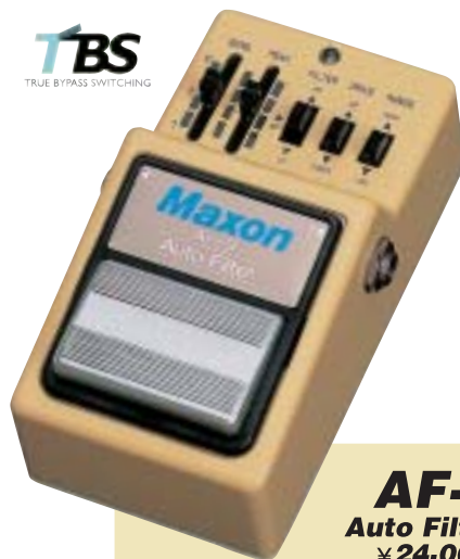
AF-9 Auto Filter ¥24,000

フォトブラ回路を使用した太く存在感のあるヴィンテージスタイルのオートワウ。コンパクトボディに大型オートワウなみの5つのコントロールを搭載し、多彩なフィルタリングが可能。RANGEスイッチをLowにすることで、フィルタされるレンジを1オクターブ下げることができ、7弦ギターやベースにも対応します。TBS(True Bypass Switching) 採用。