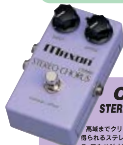
CS505 STEREO CHORUS ¥16,500

高域までクリアなコーラス効果が得られるステレオ・アナログコーラス。アルペジオに使用すれば煌びやかな響きを与え、よりいっそう引き立てることができます。ドライブ・サウンドとの相性も良く、原音のニュアンスを残しながら効果だけをブレンドしたような厚みのある効果を作りだします。ノイズゲート回路内蔵でローノイズ。