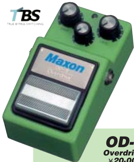
OD-9 Overdrive ¥20,000

電子スイッチ採用のエフェクターでは、エフェクトOFF時でも入力信号が電子回路を通るため、アンプに直接つないだ時に比べ音質劣化してしまうなどの問題がありました。New 9シリーズ3機種はオリジナルモデルと同形状のスイッチでトゥルーバイパスを実現し、エフェクトOFF時には信号が電子回路を一切通らず完全なバイパス状態になり、直接つないだ時に限りなく近いバイパス信号をアンプに送ります。