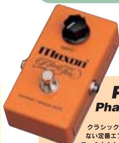
PT999 Phase Tone ¥13,800

クラシック・ロックには欠かせない定番エフェクター。1コントロールとシンプルながら、アナログらしい存在感のあるフェイズサウンドが魅力です。ダイナミックレンジを広く設定しギター、ベース、キーボードなど電子的に接続できるすべての楽器に使用できます。フェイズシフト回路は4段。