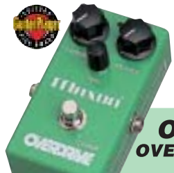
OD808 OVERDRIVE ¥14,500

現代に蘇ったオーバードライブの名機。真空管アンプをフルアップさせたときに得られる滑らかな自然なオーバードライブ・サウンドを作りだします。抜群の音キレとレンジ感ある歪みは、ギタリストの繊細なブレインユアンスを余すところなく再現。プースターとしてもアンプのキャラクターを損なうことなく最高の効果を發揮します。