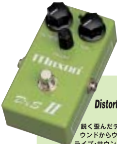
D&S II Distortion & Sustainer II ¥13,800

鋭く歪んだディストーション・サウンドからウォームなオーバードライブ・サウンドまで幅広い歪みを作りだすことができます。単体で使用しても汎用性は高くバリエーション豊かな歪みを作れますが、プースター的に使用すれば気持ち良くゲインを持ち上げ、非常に伸びやかなサステインが得られます。